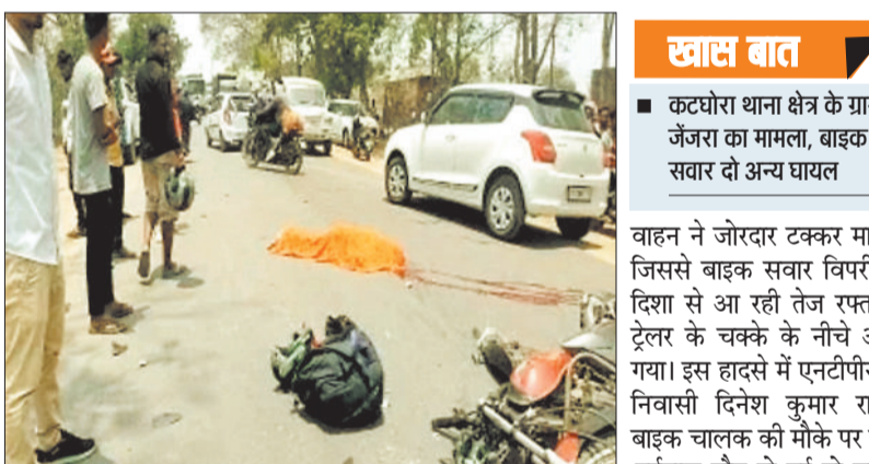
दुर्घटना के सड़क पर पड़ा मृतक का शव।

हरिभूमि न्यूज कटघोरा कटघोरा-कोरबा रोड पर जेनरा के समीप एक मोटर सायकल सवार को एक तेज रफ्तार थार वाहन के चालक ने लापरवाहीपूर्वक वाहन चलाते हुए अपनी चपेट में ले लिया। इस हादसे में बाइक सवार एक युवक की ट्रेलर के नीचे आने से मौके पर ही मौत हो गई। जबकि दो लोग गंभीर रूप से घायल हो गए। जिन्हें उपचार के लिए अस्पताल भर्ती कराया गया है। पुलिस ने मामले में अपराध पंजीबद्ध कर दुर्घटनाकारित थार चालक की तलाश शुरू कर दी है। कटघोरा थाना क्षेत्र अंतर्गत जेनरा के समीप गोडमा नाला पर सोमवार को सुबह लगभग 11:30 बजे एक मोटर सायकल सवार को तेज रफ्तार थार