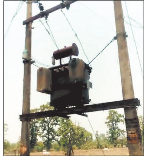
बिगड़ा पड़ा ट्रांसफार्मर।

हरिभूमि न्यूज ►► कोरबा विद्युत कंपनी के अधिकारियों की लापरवाही की वजह से ग्रामीण क्षेत्रों में विद्युत व्यवस्था पूरी तरह चरमराई है। ग्राम पंचायत घुंचापुर में पिछले 15 दिनों से ट्रांसफार्मर खराब पड़ा हुआ है जिसकी मरम्मत का इंतजार कर रहे हैं।