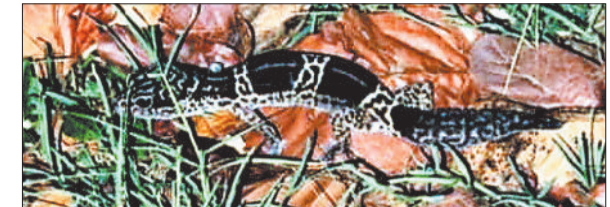
चैतुरगढ़ पहाड़ी में मिली छिपकली।

हरिभूमि न्यूज ►► कोरबा प्रकृति की खूबसूरती समेटे चैतुरगढ़ की मनोरम वादियों में छिपकली की एक ऐसी अनोखी प्रजाति मिली है, जिसका घर छत्तीसगढ़ से मीलों दूर दक्षिण भारत में है। हिल गीको नामक यह दुर्लभ प्रजाति कोरबा जिले में दूसरी बार सामने आई है। प्राणशास्त्र और वन विज्ञान के नजरिए से यह अपने आपमें कोरबा की बायोडायवर्सिटी के लिए बड़ी बात है। जिले का जंगल अनोखी वनस्पतियों और दुर्लभ वन्य प्राणियों से भरा पड़ा है जो समय-समय पर अचानक प्रकट होकर लोगों को चकित व अर्चभित करते रहते हैं। एक बार फिर कुछ ऐसा ही जीव दिखा है। यहाँ छिपकली की एक दुर्लभ प्रजाति हिल गीको मिली है। छत्तीसगढ़ में छिपकली की इस प्रजाति का मिलना अपने आप में अनोखा व महत्वपूर्ण है, जो क्षेत्र के जंगलों की जैव विविधता की समृद्धता दर्शाता है। भारत समेत विभिन्न एशियाई देशों में पाई जाने वाली छिपकली की यह प्रजाति दक्षिण भारतीय राज्यों तमिलनाडु, पुदुचेरी, कर्नाटक व महाराष्ट्र में